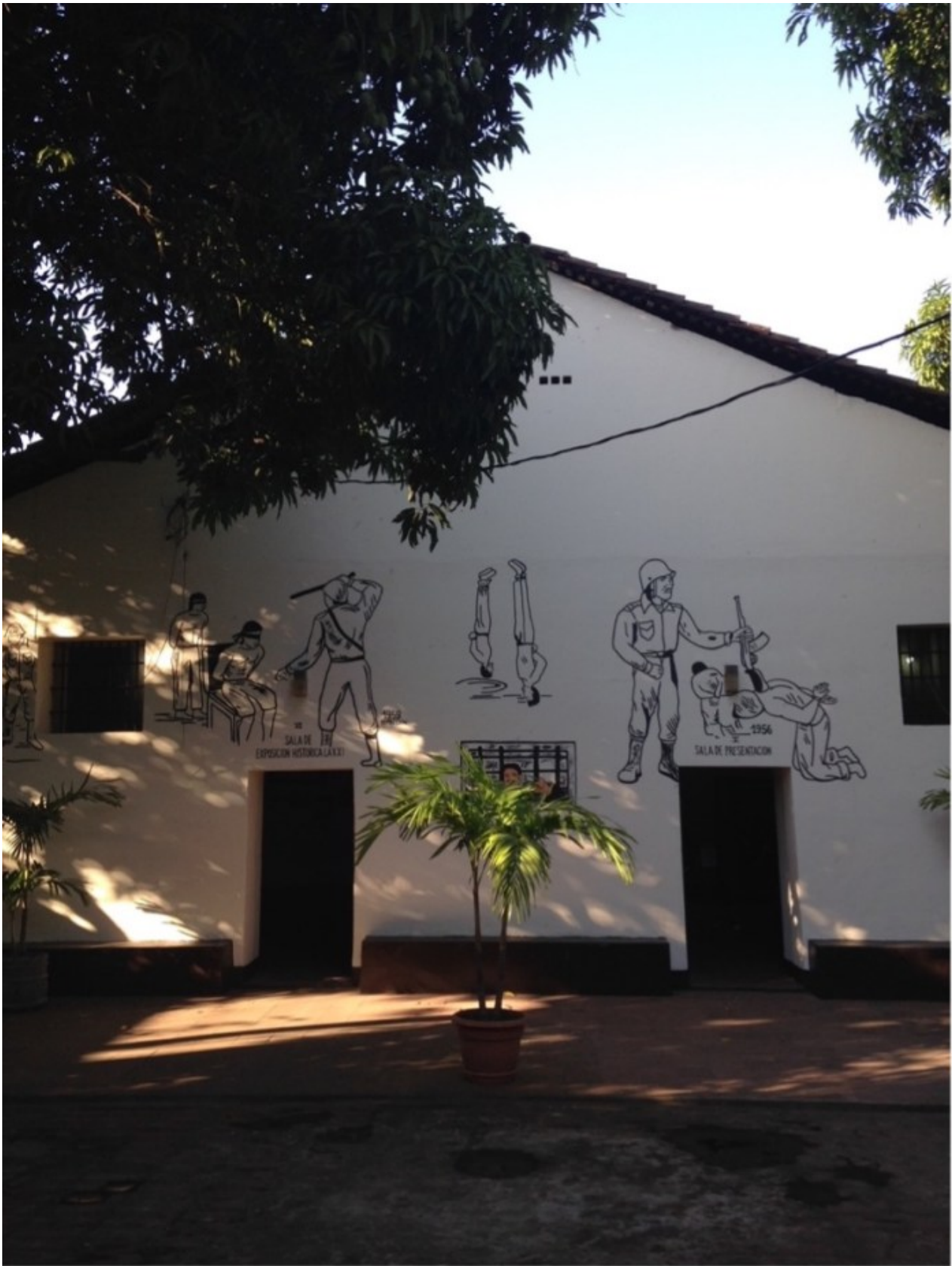
Antiguo centro de tortura y prisión de los escuadrones de la muerte de Somoza en la ciudad de León.