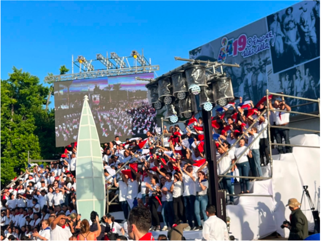
Jóvenes celebran 44th aniversario de la revolución sandinista en Managua el 19 de julio de 2023.

El 19 de julio de 1979, el Partido de la Revolución Popular Sandinista, Frente Sandinista de Liberación Nacional (FSLN), derrotó a la dinastía dictatorial títere instalada por Estados Unidos, encabezada por la familia Somoza. A continuación se muestra una foto de un tanque estadounidense tomada por el FSLN que cuelga en el antiguo centro de tortura y prisión administrado por los escuadrones de la muerte de Somoza en la ciudad de León.